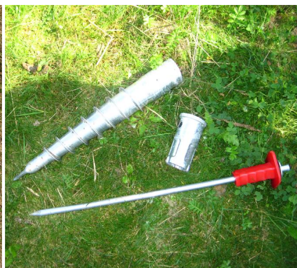
Patka, zatlukací kolík, zemní vrut