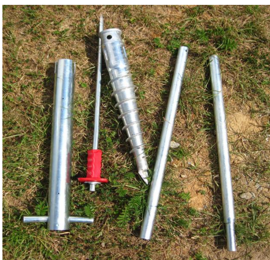
Instalační kříž, zatlukací kolík, zemní vrut